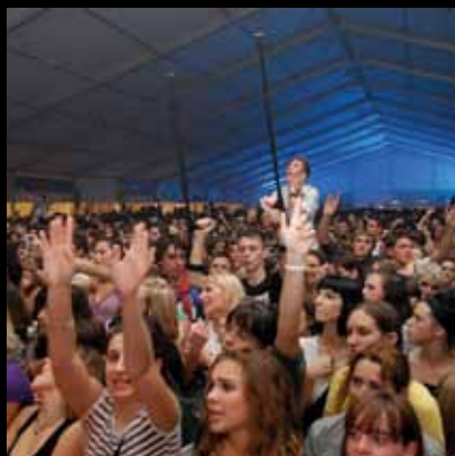
Odlična atmosfera u vinskom šatoru

Tradicionalna rujanska vinska fešta koja već 16 godina svake jeseni promovira vina i vinare ovoga kraja te najavljuje novu berbu najvažnija je manifestacija i društveni događaj u Jaski i okolici.