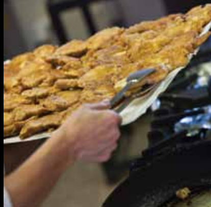
U Volavju možete uživati u zdravoj, prirodnoj hrani

Obiteljsko gospodarstvo za proizvodnju zdrave hrane, Repro Eko, nalazi se u Volavju.