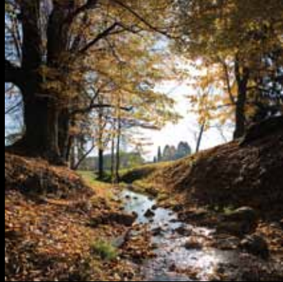
Jesen u perivoju oko dvorca Erdödy

Zahvaljujući prekrasnom položaju kojeg s jedne strane čine vrhovi Plešivice, a s druge niska predjela Pokuplja te sve upotpunjuju tokovi rijeka i brojnih potoka, Jastrebarsko i njegova okolica raj su za ljubitelje prirode.