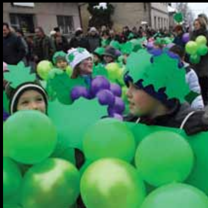
Na jaskanskom fašniku najviše uživaju djeca

Jaskanski fašnik tradicionalna je manifestacija koja okuplja velik broj sudionika, ali i posjetitelja.