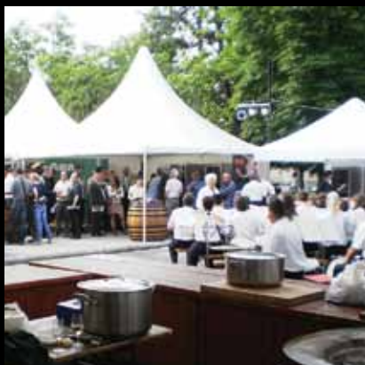
Ljubitelji Vinskih igara na glavnom jaskanskom trgu

Manifestacija se održava od 1984. godine u organizaciji Kluba prijatelja dobrog vina.