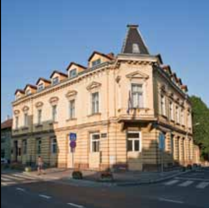
Zgrada u centru grada okupana suncem