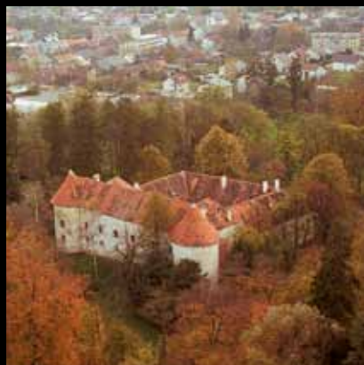
Jaskanski dvorac iz ptičje perspektive

Smješten nedaleko centra grada u parku koji je hortikulturni spomenik, dvorac Erdödy najstarije je zdanje u gradu.