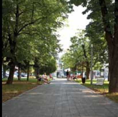
Jaskanska promenade – glavni gradski trg

Samo zakoračite i bit će vam jasno da će svaki trenutak proveden ovdje biti poseban. Otkrit ćete krajolik bogat kontrastima; pitomo vinorodno prigorje, divlju i netaknutu prirodu te bogatstvo šuma i voda Crne Mlake.