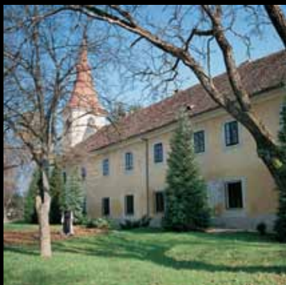
Drevni franjevački samostan čuva tajne prošlih stoljeća