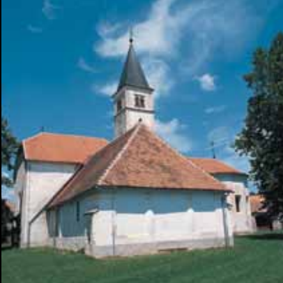
Volavska Gospa Snježna pruža utočište vjernicima već pet stoljeća