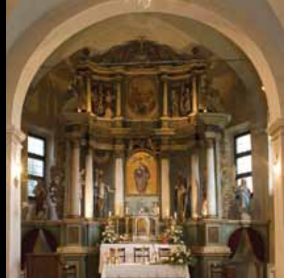
Barokno carstvo Volavja – glavni oltar volavske crkve

Čuvena kapela Blažene Djevice Marije Snježne u Volavju smještena je usred naselja i okružena zidanom ogradom s baroknim portalom iz 1732. Crkva je bogato oblikovana klesarskim detaljima i ima vrijedan barokni inventar. Prvotno je sagrađena srednjovjekovna kapela iz 15. stoljeća, a nova crkva dovršena je 1704. Zvonik je iz 17. stoljeća, a u 18. stoljeću je povišen.