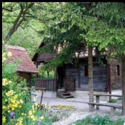
Živopisno dvorište Mlinarove iže

Na području Jastrebarskog, kraja bogatom vodom, nekada je radilo mnogo mlinova. Zanimanje mlinara bilo je časno, a mlinovi su bili važna karika seoskog života.