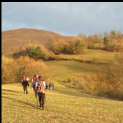
Blage padine Plešivice mame ljubitelje prirode i planinarstva

Laganom šetnjom do vrha Japetića ili Plešivice stižete za samo sat vremena hoda. Za obilazak popularnog Jaskanskog planinarskog puta potrebna su Vam puna dva dana.