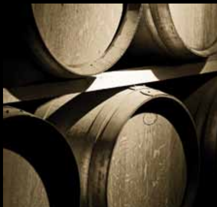
Drevni podrum obitelji Erdödy u kojem danas svoja vrhunska vina čuva tvrtka Mladina

Još davne 1736. grof Erdödy izgradio je svoj vinski podrum u Mladini, nasuprot današnje slavne motokros staze. Podrum je bio u vlasništvu grofova Erdödy sve do 1922, kada je umro posljednji grof, Stjepan Erdödy. Od tada se promijenilo još nekoliko vlasnika sve do 1998. kada podrum prelazi u vlasništvo Jamnice, odnosno tvrtke Agrokor.