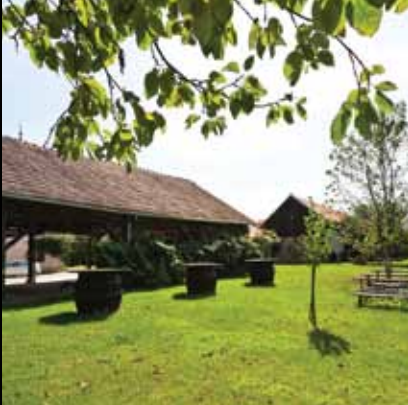
Obnovljeno staro imanje obitelji Repar