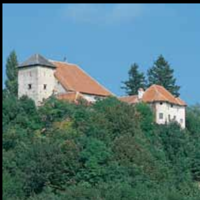
Biser slavetičkog kraja

U zelenom kutku pitomog slavetičkog kraja prošaranog voćnjacima, vinogradima i cvjetnim livadama, na vrhu brijega nasuprot župne crkve svetog Antuna Pustinjaka iz 1600, smješten je dvorac grofova Oršić. Stari grad spominje se 1294. u sklopu Podgorske županije, a nakon što je promijenio nekoliko gospodara, 1468. dolazi u posjed grofova Oršić sve do 1869. kada mu vlasnik postaje Levin Rauch.