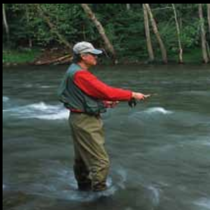
Raj za ribare

Ljubitelji ribolova mogu uživati u visinskim i nizinskim potočnim vodama te jezerima Dubrava, Gović i park Erdödy. Glavne vrste riba su šaran, som, amur, linjak, klen, kečiga, jegulja i deverika. Ribolov se organizira uz dnevne ribolovne dozvole.