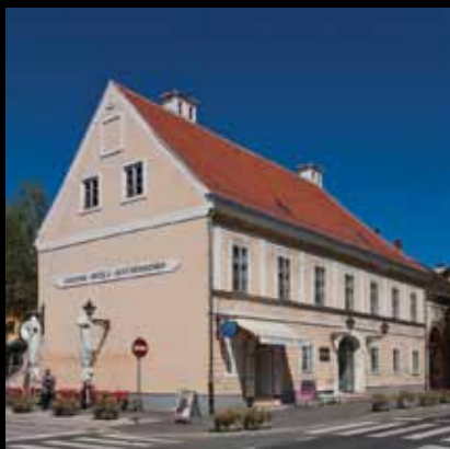
Gradski muzej Jastrebarsko – čuvar baštine jaskanskog kraja