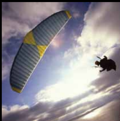
Na pola puta između neba i zemlje

Ukoliko ste željni adrenalina i prekrasnog panoramskog pogleda na pitomi jaskanski kraj, okušajte se u letačkim sportovima koji predstavljaju pravi užitek!