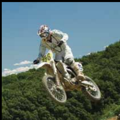
S omiljenim motorom u nebeske visine

Jedna od najljepših i najzahtjevnijih motokros staza u Europi nalazi se upravo kod nas, u Mladini nedaleko Jastrebarskog.