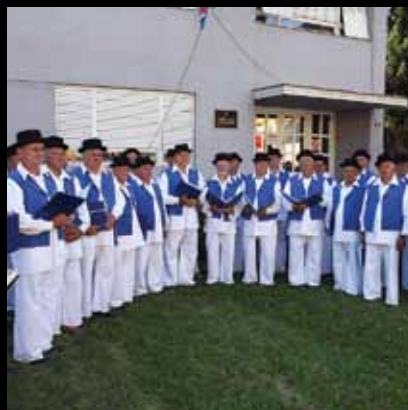
Pjevački zbor Antun Radić iz Okića slavi Vladka Mačeka

Jedan od najznamenitijih sinova jaskanskog kraja, Vladko Maček, svakoga je srpnja razlog dolaska brojnih utjecajnih osoba iz društvenog, kulturnog i političkog života Hrvatske u Jastrebarsko.