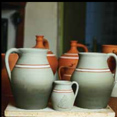
Proizvodi od gline