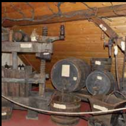
Vrijedna etno zbirka svetojanskog kraja