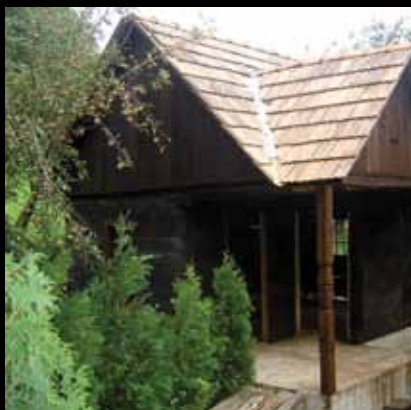
Godrijanov mlin, izgrađen 1890, a obnovljen 2007. godine