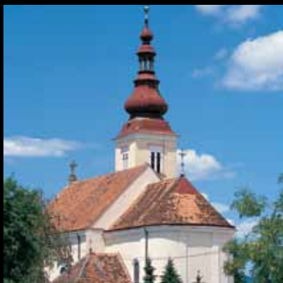
Elegantni obrisi jaskanske župne crkve