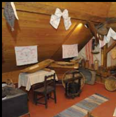
Detalji iz etnografske zbirke

Ova mala ali vrijedna etno zbirka podsjeća na bogatu kulturnu baštinu svetojanskog kraja. Stara iža s tradicionalnim oruđem i namještajem, narodnim nošnjama, kunjom , komorom i najžom dočarava način života naših starih u društvenim ižama .