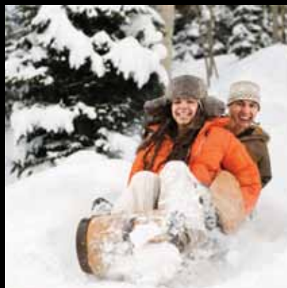
Snježne radosti na jaskanskim bregima

Naš grad i kraj od davnih dana središte je brojnih sportskih aktivnosti i sportskih klubova. Tako je u Jaski već 1902. djelovao Hrvatski klub koturaša Jastreb, a od 1906. Hrvatski Sokol.