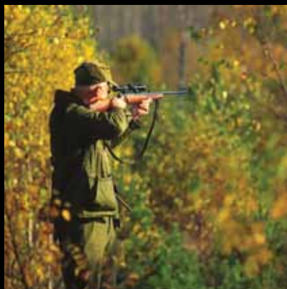
Obilje divljači mami ljubitelje lova

Jaskanski kraj tradicionalno je vezan uz lovni turizam. Na 18 lovišta ukupne lovne površine 54000 hektara moguće je naći obilje krupne i sitne divljači poput srndaća, divljih svinja, zečeva, fazana, prepelica i divljih patki.