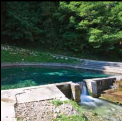
Plavo-zelena ljepota Svete Jane

Zdrava, izvorska pitka voda danas je gospodarski simbol Svete Jane.