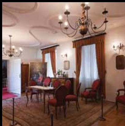
Raskošni interijer građanske sobe iz 19. stoljeća

Gradski muzej i galerija smješteni su u reprezentativno preuređenoj zgradi stare gradske vijećnice, građenoj 1826. U muzeju se čuva arheološka, kulturno-povijesna i etnografska baština jastrebarskog kraja. Ovdje je izložena i glasovita bula – povelja kralja Bele IV. kojom je 12. siječnja 1257. Jastrebarsko dobilo status slobodnog kraljevskog trgovišta.