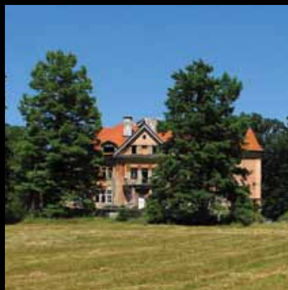
Secesijski dragulj Crne Mlake

U središtu močvarnog područja, koje se početkom 20. stoljeća počinje pretvarati u ribnjake Crna Mlaka, a oko 1905. u zakup ga dobiva Kornelius Zwilling, u razdoblju od 1914. do 1920. gradi se kompleks vile, perivoja i popratnih zgrada po nacrtima arhitekta J. Deutscha (1917) u stilu kasne secesije.