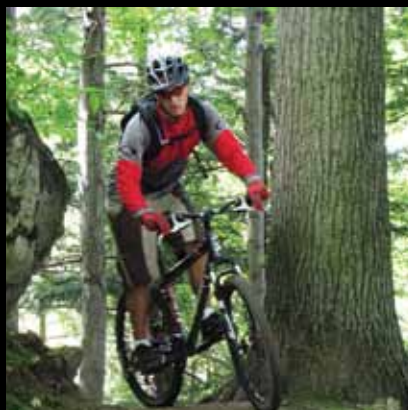
Klub koturaša osnovan je 1902.

Vozeći se biciklom mnogobrojnim označenim i neoznačenim stazama, šumskim putevima i cestama upoznajte Jaske i okolicu na najbolji mogući način.