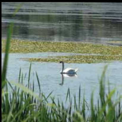
Spokoj i ljepota Crne Mlake