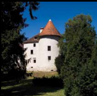
Stari ljepotan sniva stoljetni san okružen drevnim stablima