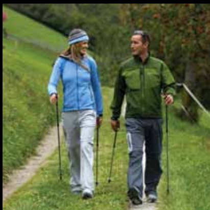
Aktivan odmor u Jastrebarskom