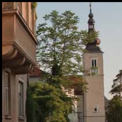
Ponosan i prkosan – zvonik crkve svetog Nikole

Župna crkva svetog Nikole u Jastrebarskom prvi put se spominje u povelji Bele IV. kojom 1257. Jastrebarsko dobiva povlasticu slobodnog kraljevskog grada. Također se nalazi u popisu arhidakona goričkog Ivana iz 1334.