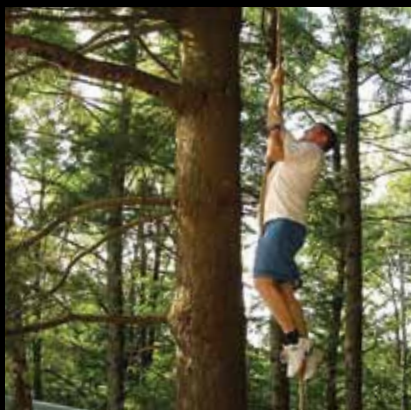
Sudionici natjecanja Zelene livade mogu pokazati snagu penjući se po užetu...