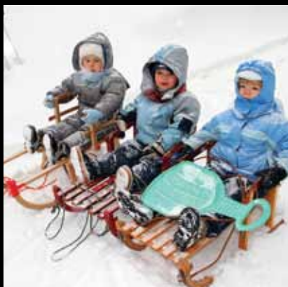
Najmlađi sanjkaši na najstarijoj hrvatskoj sanjkaškoj stazi

Na Plešivici se nalazi najstarija sanjkaška staza u Hrvatskoj!