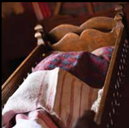
Stara tradicionalna zipka