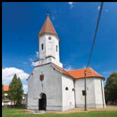
Petrovinski zvonik već četiri stoljeća poziva na molitvu i zajedništvo

Crkva svetog Petra u Petrovini jedinstveni je spomenik kulture jaskanskog kraja najviše spomeničke vrijednosti.