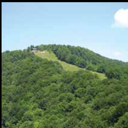
Šumski raj Japetića

Japetić, najviši vrh Plešivice (879 m), zbog svoje je očuvane prirodne ljepote proglašen rezervatom šumske vegetacije. Posebno su vrijedne bukove šume, ali i bogata planinska flora koja prekriva gorske livade.