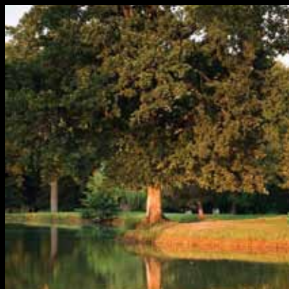
Sve nijanse zelene u skladu vode i bilja

Park je oblikovan u slobodnom stilu i predstavlja nastavak na prirodnu šumu, koja i danas zauzima zapadno područje parka. Od autohtonih elemenata ističu se primjerci hrasta lužnjaka, javora, crvenolisne bukve i graba.