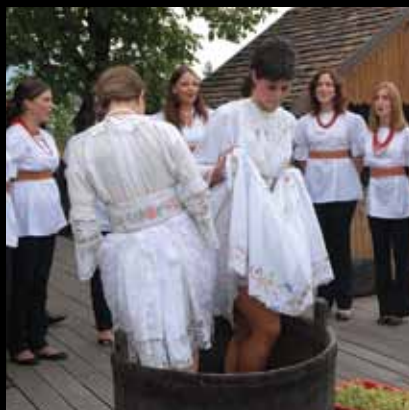
Tradicionalan način gnječenja grožđa

VINSKI SVECI – VINCEKOVO, URBANOVO, MIHOLJE I MARTINJE