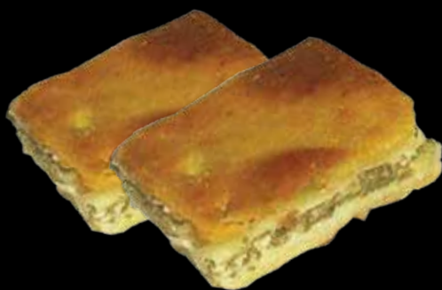
Copanjek – autohtoni plešivički specijalitet

Autohtoni slani prhki kolač pripremljen od sastojaka dostupnih u svakom pravom jaskanskom domu izvorni je plešivički specijalitet. Ime je dobio prema riječi copati što znači umijesiti vješto i brzo!