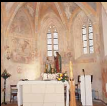
Župna crkva u Petrovini – oaza mira, tišine i spokoja