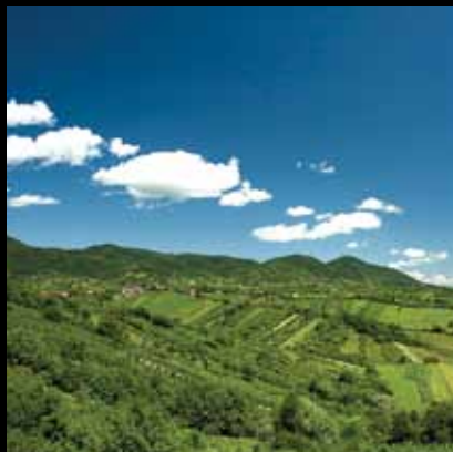
Pogled na jaskanski kraj okupan suncem

Od Jastrebarskog udaljena sedam kilometara, Plešivica se uzdigla visoko uz istoimeni planinski greben (779 m), nudeći se oku u punoj raznolikosti i ljepoti.