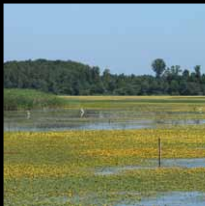
Neprocjenjivo bogatstvo ribljeg i ptičjeg svijeta

Najvrednija prirodna baština Jastrebarskog i okolice svakako je ornitološki rezervat Crna Mlaka. Nalazi se u središnjem dijelu močvarno-šumskog područja, 11 kilometara jugoistočno od centra Jastrebarskog.