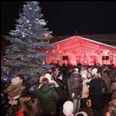
Toplina Božića na snijegom prekrivenom jaskanskom glavnom trgu

Božić u Jaski manifestacija je koja se svake godine u božićno vrijeme održava na glavnom gradskom trgu.