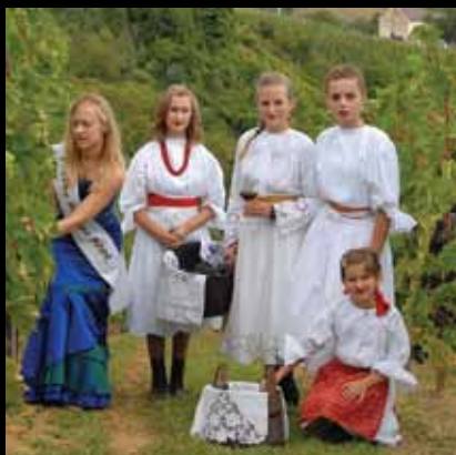
Vinska kraljica u plešivičkom vinogorju