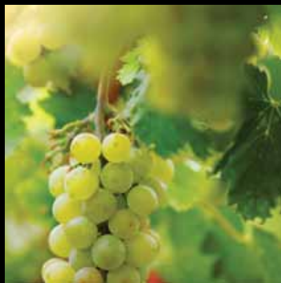
Plešivičko grožđe mami bojom, okusom i mirisom

Plešivička vinska cesta otvorena je 2001, a danas na njoj djeluje 35 gospodarstava s raznolikom turističkom ponudom.