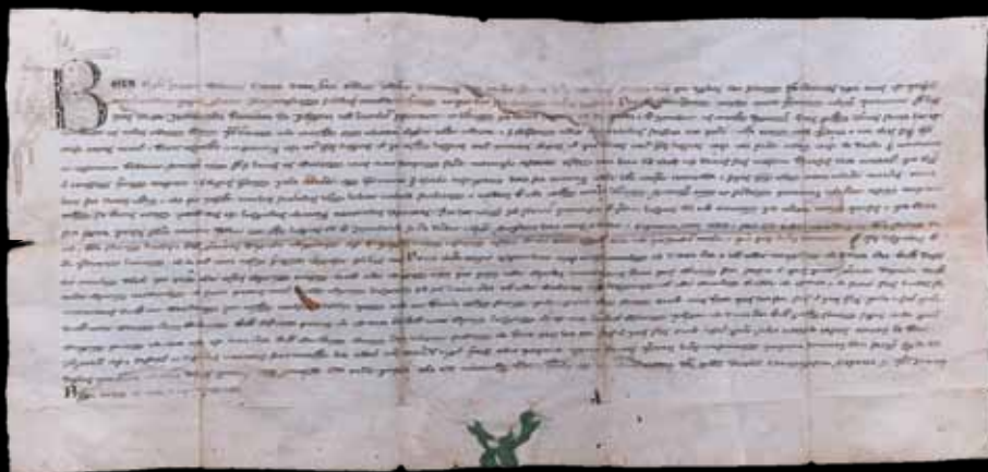
Bula – povelja Bele IV. kojom je Jastrebarsko 1257. postalo slobodno kraljevsko trgovište

Jastrebarsko je dobilo ime po jastrebarima, srednjovjekovnim uzgajivačima lovnih ptica, jastrebova i sokolova. Mjesto od davnine u svom grbu ima jastreba.