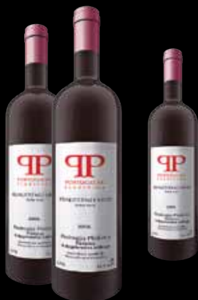
Tradicionalna plešivička vinska sorta i prvo mlado vino u Hrvatskoj

U jaskanskom kraju zaštitni znak jeseni je – mlado crno vino. Portugizac, robna marka Zagrebačke županije i prvo mlado vino kontinentalne Hrvatske, nudi svoju rumenu vinsku dušu uz pečeno kestenje, paprenjake, sir, orahe i slične domaće slastice.