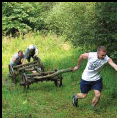
... ili gurajući drvena kola

Manifestacija koja se održava još od 1981. u Volavju kraj Jastrebarskog njeguje tradiciju naših baka i djedova kroz pučko-pastirske igre poput gađanja lukom i strijelom, guranja drvenih kola kroz šumu, bacanja štapa u dalj rukom i nogom, hodanja na štulama, prasičkanja, kozanja, potezanja konopa i penjanja po užetu.