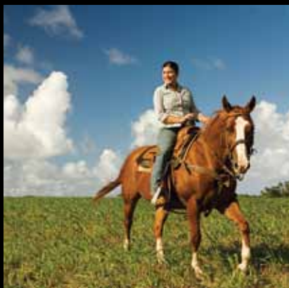
Upoznavanje jaskanskog kraja u kaubojskom stilu

Škole jahanja, terensko rekreativno jahanje, rehabilitacijsko jahanje, vožnja kočijama – odaberite nešto od ove ponude, provedite dan s ovom plemenitom životinjom odraslom na jaskanskim pašnjacima i uživajte u prekrasnoj prirodi.