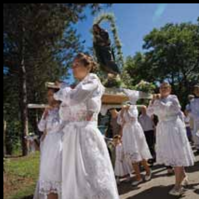
Tradicionalno škapularsko proštenje u srpnju

Ovo izvanredno sakralno zdanje spada u najvišu kategoriju spomeničke vrijednosti u Hrvatskoj. Gotička jezgra izgrađena je u 16. stoljeću, a podizanjem istočnog i zapadnog krila početkom 18. stoljeća, samostan i crkva dobivaju barokni karakter. Posebnost zdanja svakako su bogat barokni inventar i brojne umjetnine.