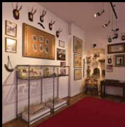
Interijer Gradskog muzeja i galerije Jastrebarsko

Želite li putovati kulturološki kroz prostor i vrijeme, područje Jastrebarskog i okolice s nizom vrijednih sakralnih objekata, dvoraca, kurija i kulturnih institucija idealno je mjesto za Vas!