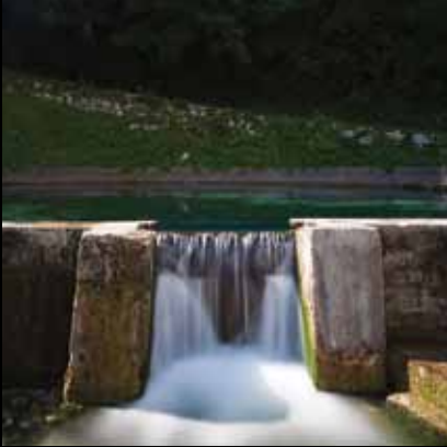
Staro termalno vrelo Sveta Jana