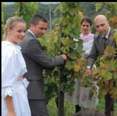
Svečani početak berbe u rujnu