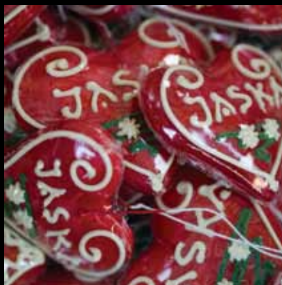
Licitarsko srce – tradicionalni hrvatski suvenir