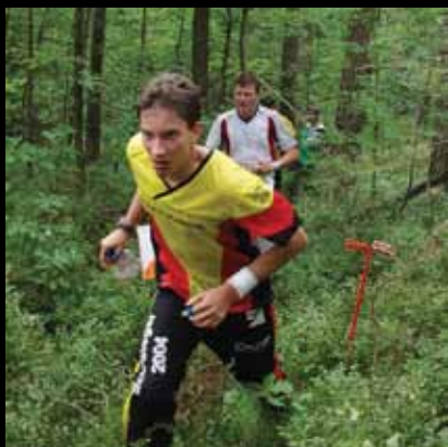
Jaskanski atletičari postižu odlične rezultate

Šumski tereni oko Jaske pravi su raj za ljubitelje orijentacijskog trčanja. Okolicu Jaske djelomično pokriva šest orijentacijskih zemljovida ukupne površine 30 km 2 .