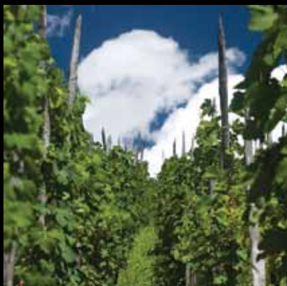
Naši vinogradi – idealan spoj plavog, bijelog i zelenog